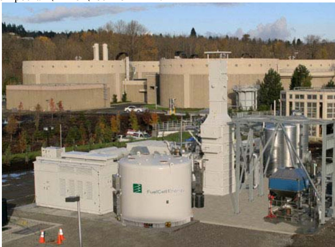
Рисунок 2. Электростанция на ТЭ в King County, Вашингтон (1 МВт)

По большинству технических характеристик разрабатываемая, в настоящее время, ФГУП «ЦНИИ СЭТ» энергоустановка с топливными элементами мощностью 10 кВт удовлетворяет требованиям для РЭУ, изложенным в таблице 1. Требуемая установленная мощность одной РЭУ может быть достигнута включением в состав РЭУ необходимого количества типовых модулей-батарей ТЭ, при этом, первоначально установленная мощность одной РЭУ может составлять 100 - 500 кВт, а для микрорайона необходимо будет формировать блоки из нескольких РЭУ. Последовательно внедряя ЭУ с ТЭ разной мощности, от 10 до 100 и более кВт, к 2010 году возможно начать выпуск энергоустановок установленной мощностью 1,0 - 5,0 МВт. Такие энергоустановки с полным циклом получения, хранения и использования водорода уже строятся за рубежом. На рисунке 2. показана электростанция мощностью 1 МВт.