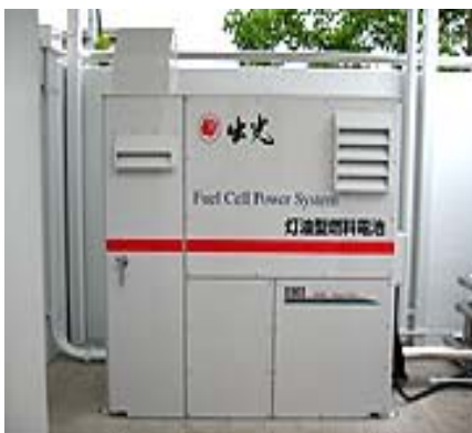
1). 5 кВт. установка с ТЭ Idemitsu Kosan (Япония)