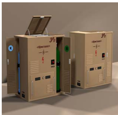
2). 10 кВт. установка с ТЭ, разрабатываемая ФГУП «ЦНИИ СЭТ»